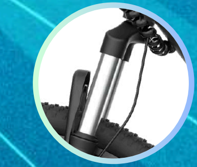
Horquilla delantera SA SUNTOUR