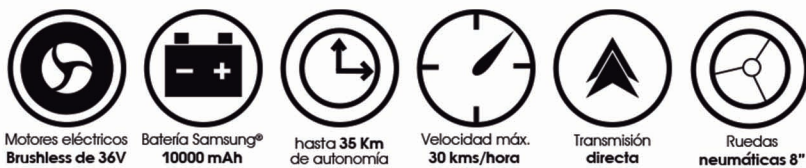
Motores eléctricos Brushless de 36V