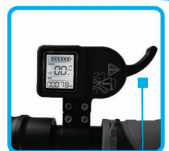
Display y acelerador